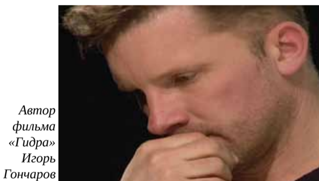
Автор фильма «Гидра» Игорь Гончаров